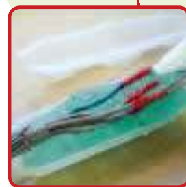
AANSLUITINGEN ONDER WATER