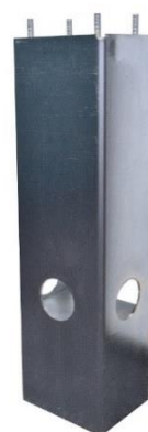
Ingraaf sokkel voor paal 180132417 (staal verzinkt)

Heeft u specifieke wensen, neem gerust contact met ons op!